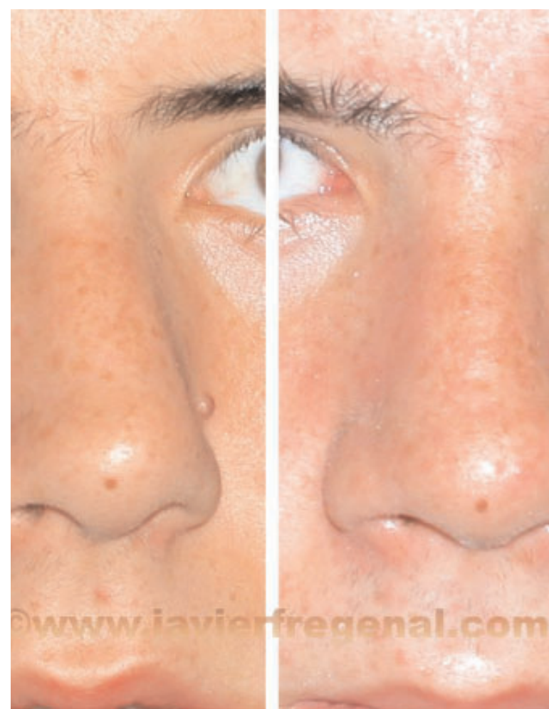
Corrección de la forma y función respiratoria por rinoseptoplastia (Foto 4).

También exige un largo proceso de aprendizaje, que, como todo en medicina, se inicia en los li-