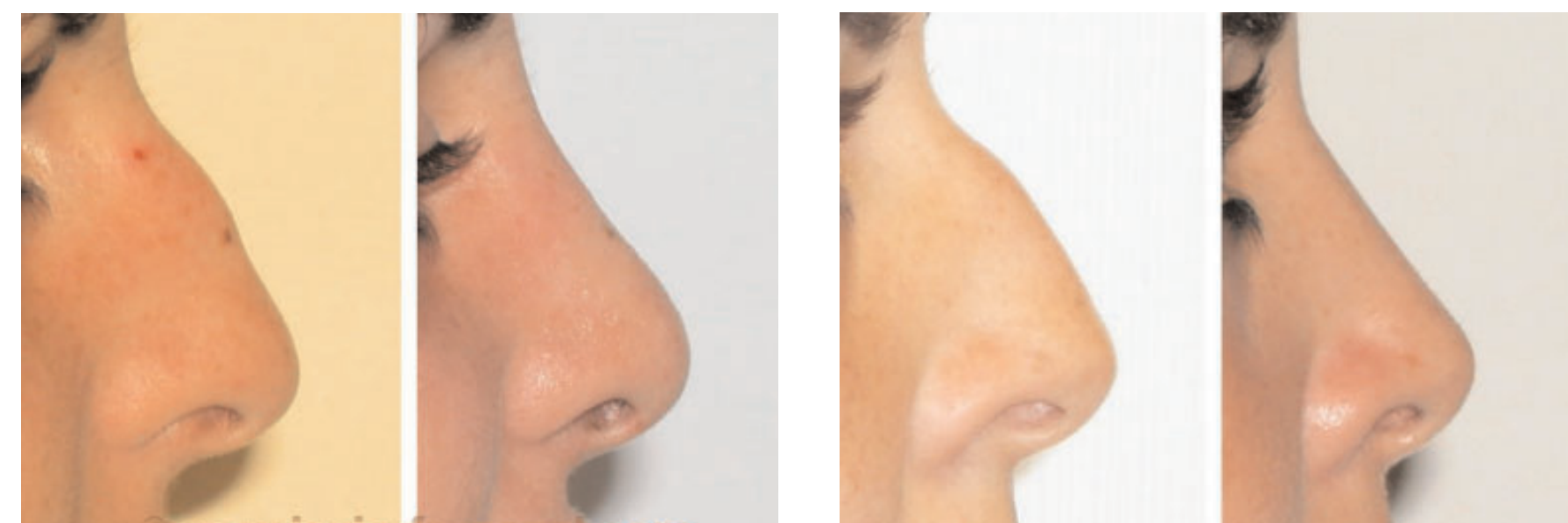
Resultados de la rinoplastia (Foto 2).

Una vez establecido el problema y el plan quirúrgico (Foto 1),